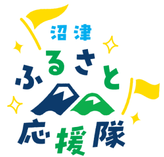
ふるさと応援隊ロゴマーク

沼津の魅力をより効果的に PR するため、ふるさと応援隊のロゴマークを作成しました！