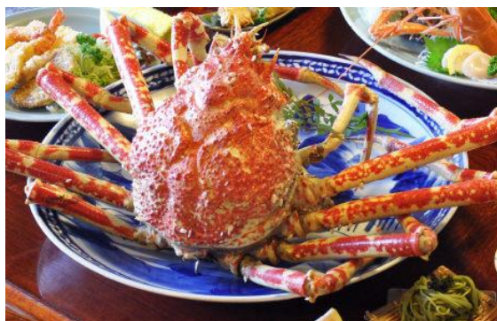
戸田港で水揚げられたタカアシガニ