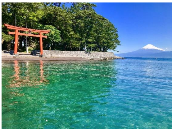
戸田の海から望む富士山

海からの交流人口の拡大に向け、こうした地域資源を積極的にPRするとともに、すでに認定されている「ぬまづ港 海の駅」「ぬまづ・えのうら 海の駅」と連携して、より魅力あふれる海の回遊コースとなるよう取り組んでいます。