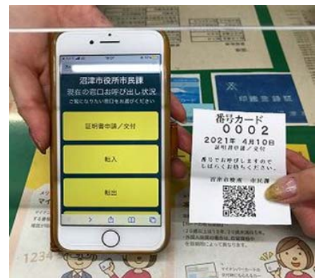
スマートフォン表示イメージ