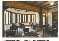
強羅花壇・懐石料理花壇 （旧閑院宮御別邸） 管理者：強羅花壇