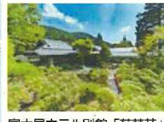
富士屋ホテル別館「菊華荘」 （旧宮ノ下御用邸） 管理者：富士屋ホテル（株）