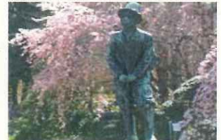
昭和天皇陛下より贈られた登山服姿の秩父宮殿下銅像とシダレザクラ