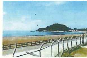
沼津御用邸記念公園からの奥駿河湾の眺め