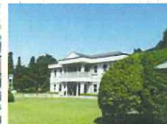
恩賜箱根公園 管理者：神奈川県 指定管理者：（公財）神奈川県公園協会・（株）ランドフローラ