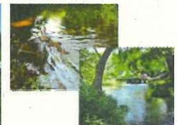
三島市立公園楽寿園 管理者：三島市