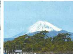
沼津御用邸記念公園 管理者：沼津市 指定管理者：（株）呉竹荘・（株）日比谷アメニス