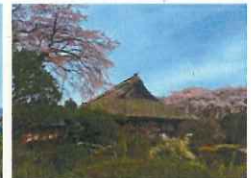
秩父宮記念公園 管理者：御殿場市 指定管理者：御殿場総合サービス（株）