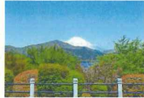
往時の箱根離宮西洋館礎石からの眺望 満開のフジ越しの楽寿館

② 三島市立公園楽寿園（公共7.5ha） 「小松宮彰仁親王殿下御別邸」跡地の庭園