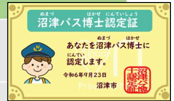
↑裏面にバスの写真