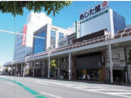
右:さんさん通り「お肉とお野菜 あした葉」 左:仲見世商店街「大衆酒場たばちゃん」「韓国市場 CHAN MART」