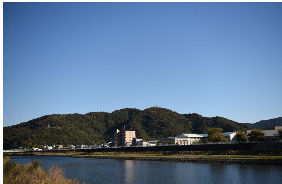
① 香貫山の自然景観