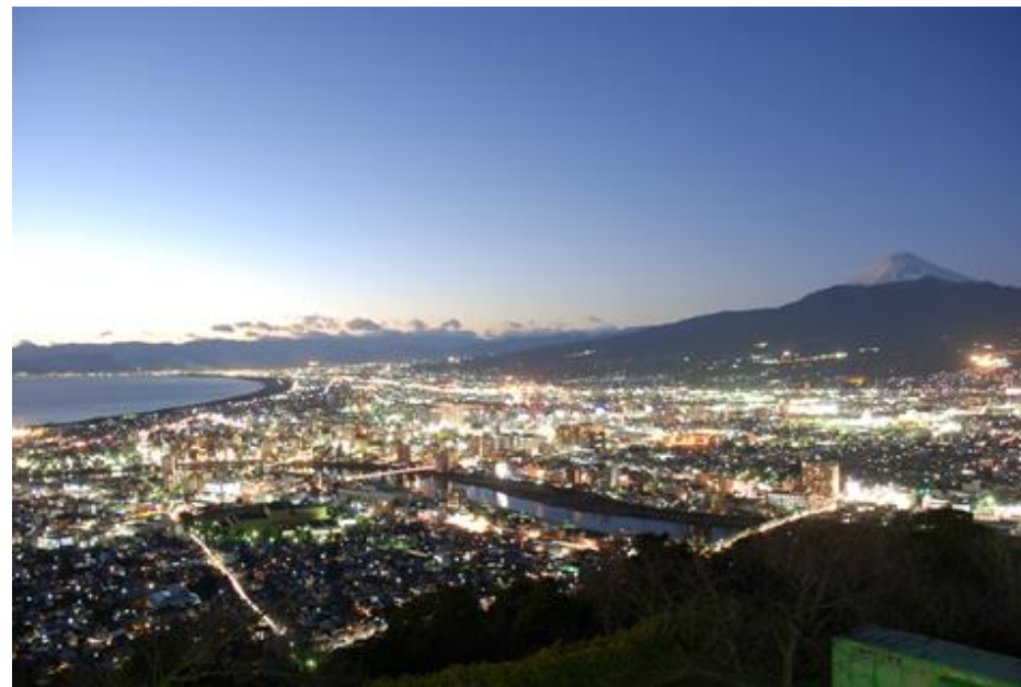
② 展望台から見渡す美しい眺望