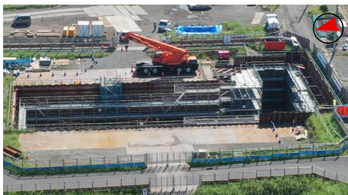
①一本松アンダー道路を西側から撮影(R6.9月撮影)

令和9年度末の完成を目指し、今年度も整備を着々と進めています！ 引き続き、コンテナホームやフロント部の基盤整備、施設内の管路埋設、構内跨線橋の橋脚工事などを実施しています。また、一本松アンダー道路は、掘削が終わり、今後、道路本体のボックスを築造していきます。