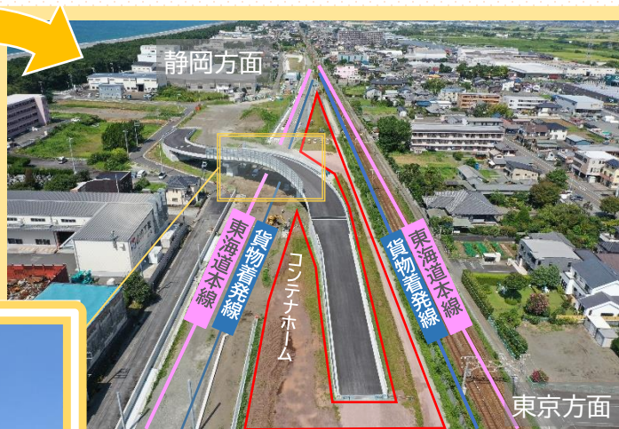
新貨物ターミナル(R7.8)

また、コンテナホームが舗装され、東海道本線1本、貨物着発線2本の敷設が始まるなど、着々と整備が進められています。