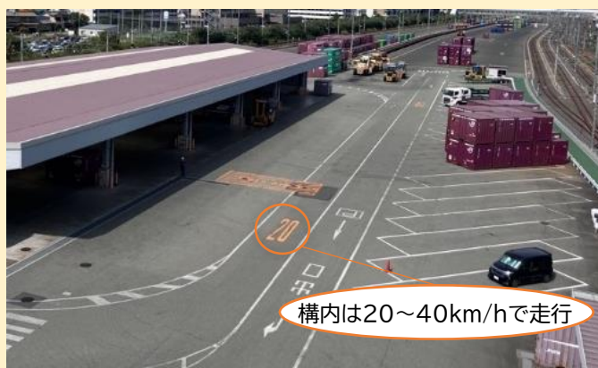
吹田貨物ターミナル駅の様子

駅構内は、トラックの速度制限や荷役機械の作業音を最小に抑えるなど、地域の生活環境への配慮がされていました。また、地域イベントの積極的な開催や年1回の地元報告会など、地元の方々とのつながりを大切にしている姿勢が印象的でした。沼津の新貨物ターミナルでも、地元の皆様の意見を聞きながら周辺住環境に配慮した取組を検討してまいります。