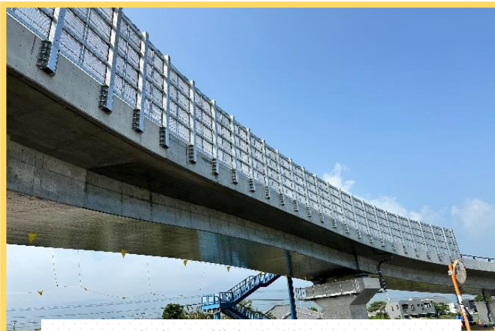
完成した構内跨線橋の様子

また、コンテナホームが舗装され、東海道本線1本、貨物着発線2本の敷設が始まるなど、着々と整備が進められています。