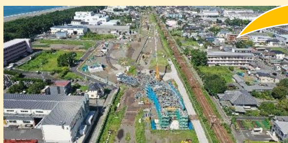
新貨物ターミナルの様子(R6.8)

この橋は、主に貨物コンテナを輸送するためのトラックが、線路に挟まれたコンテナホームへ渡るために使用されることになります。