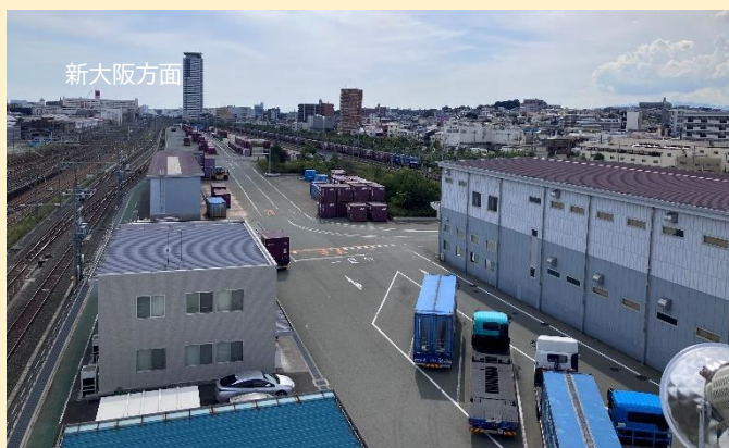
吹田貨物ターミナル駅の様子

貨物列車の様子や周辺住環境に配慮した取組について、先進地事例である 大阪の吹田貨物ターミナルを視察してきました。