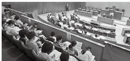
▲議場で熱心にメモを取る子どもたち

普段は立ち入ることのできない議員席で、市議会の仕組みや議員の仕事について職員から説明を受けると、子どもたちは熱心にメモを取っていました。その後、議会の役割等に関する様々な質問がありました。