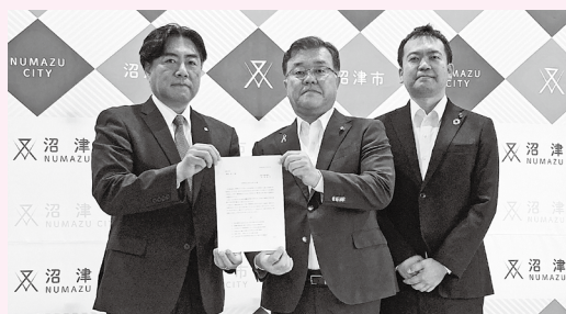
▲市長へ申入れ書を提出する正副議長