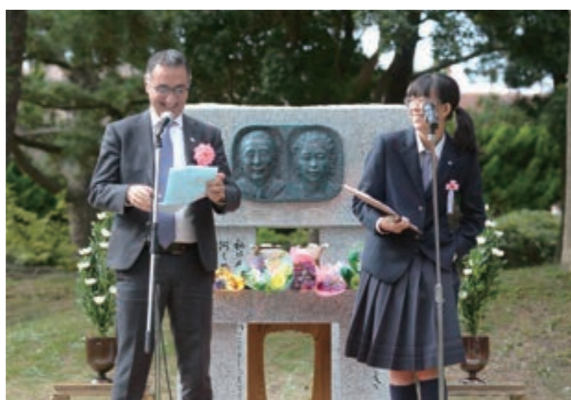
イスラエル・コーヘン大使