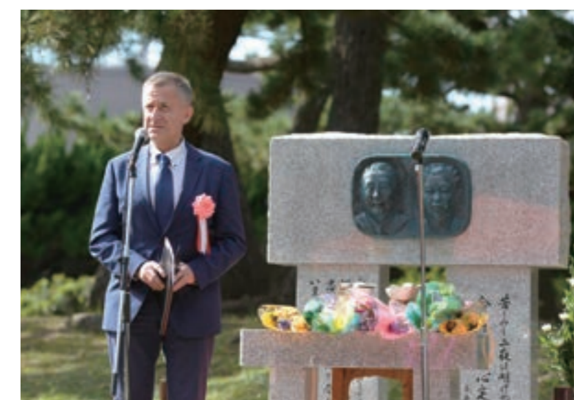
ポーランド・文化担当