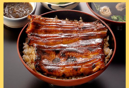
新聞掲載！柔らか鰻(沼津うなよし) 加齢・病気・ケガにより、かむ力、 飲み込む力が弱まった人も 『見た目/味は同じでも柔らかいうな丼』