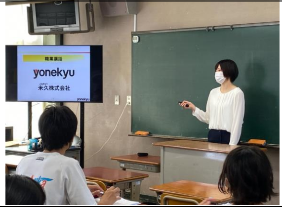
【米久株式会社の方】

沼津信用金庫は、地域の人々の夢や願いをお金の面から支える仕事をしています。性別関係なく働きやすく、管理職になることもできます。私は就職前、沼津信用金庫の営業業務で活躍する女性の社員さんに惹かれて「ここで働こう」と思いました。彼女は結婚、出産をした現在も働いています。目指したい素敵な先輩がいる会社です。