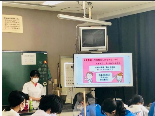
【沼津市立病院の方】

現在静岡県警察では、全警察官の割となる約 600 人の女性警察官が、刑事、生活安全、交通、地域などの各分野で活躍しています。DV 等の女性や子供が被害者となる犯罪が増える中、女性警察官として必要な場面が多くなっています。警察学校では警察官として必要な体力づくりや訓練を行うので、体力面についても心配することなく、警察官として仕事をすることが出来ます。