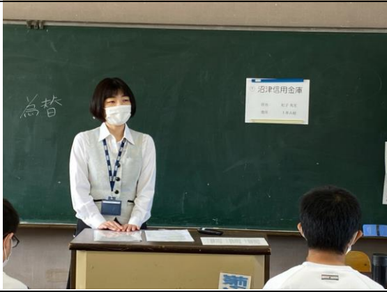
【沼津信用金庫の方】

沼津信用金庫は、地域の人々の夢や願いをお金の面から支える仕事をしています。性別関係なく働きやすく、管理職になることもできます。私は就職前、沼津信用金庫の営業業務で活躍する女性の社員さんに惹かれて「ここで働こう」と思いました。彼女は結婚、出産をした現在も働いています。目指したい素敵な先輩がいる会社です。