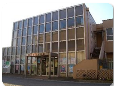
沼津市商工会館(本所)