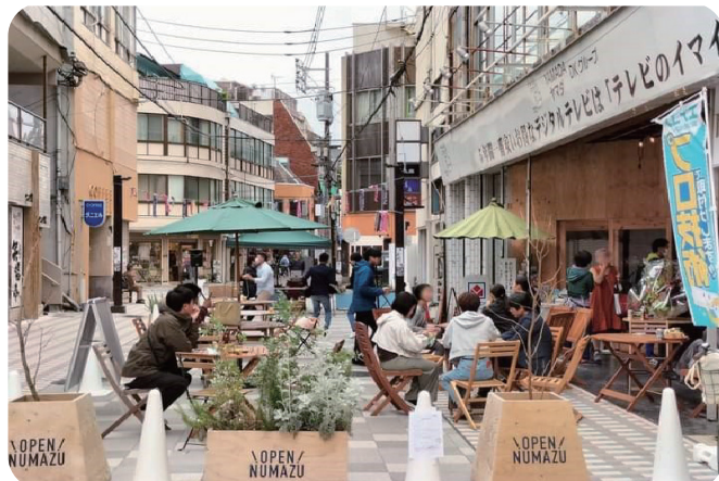
PASO と新仲見世商店街