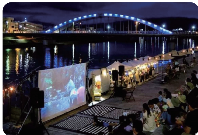
Retreat in the city

沼津市では、2015年から始まったリノベーションまちづくりの取組により、多くの事業や活動が創出されてきました。そのネットワークが広がり、沼津を楽しむ人たちが、市内のあらゆる場所で増えてきています。