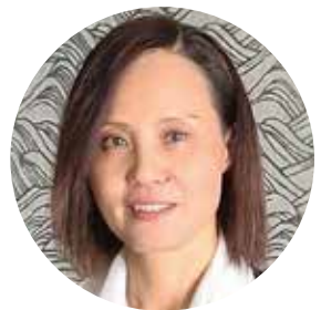
株式会社 China285 代表取締役