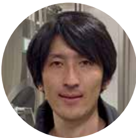
株式会社 ONEDROP 醸造責任者