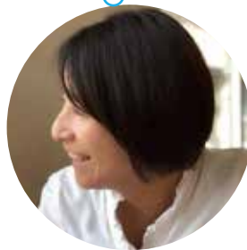
NewStand+ 店長 / 沼津経済新聞記者