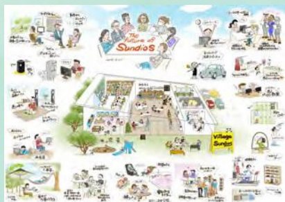
完成イメージ (内容と本企画は関係ありません)

グループディスカッションから出た意見を語り合う座談会。 みなさんからの意見をブレスト形式でワークしながら、 出た意見をビジュアルに起こす グラフィックレコーディングを開催します。 商店街関係者さん、商店街に出店してみたい方などなど、 ぜひ見学にいらしてください。