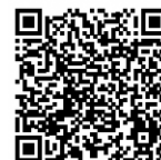
Página web Tablero de mensajería en caso de desastre

Es un tablero de mensajes en internet para verificar la seguridad de personas. Es necesario registrarse. Otras compañías de teléfono también ofrecen servicios de tableros de mensajería.