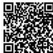
夜间商谈窗口开设日