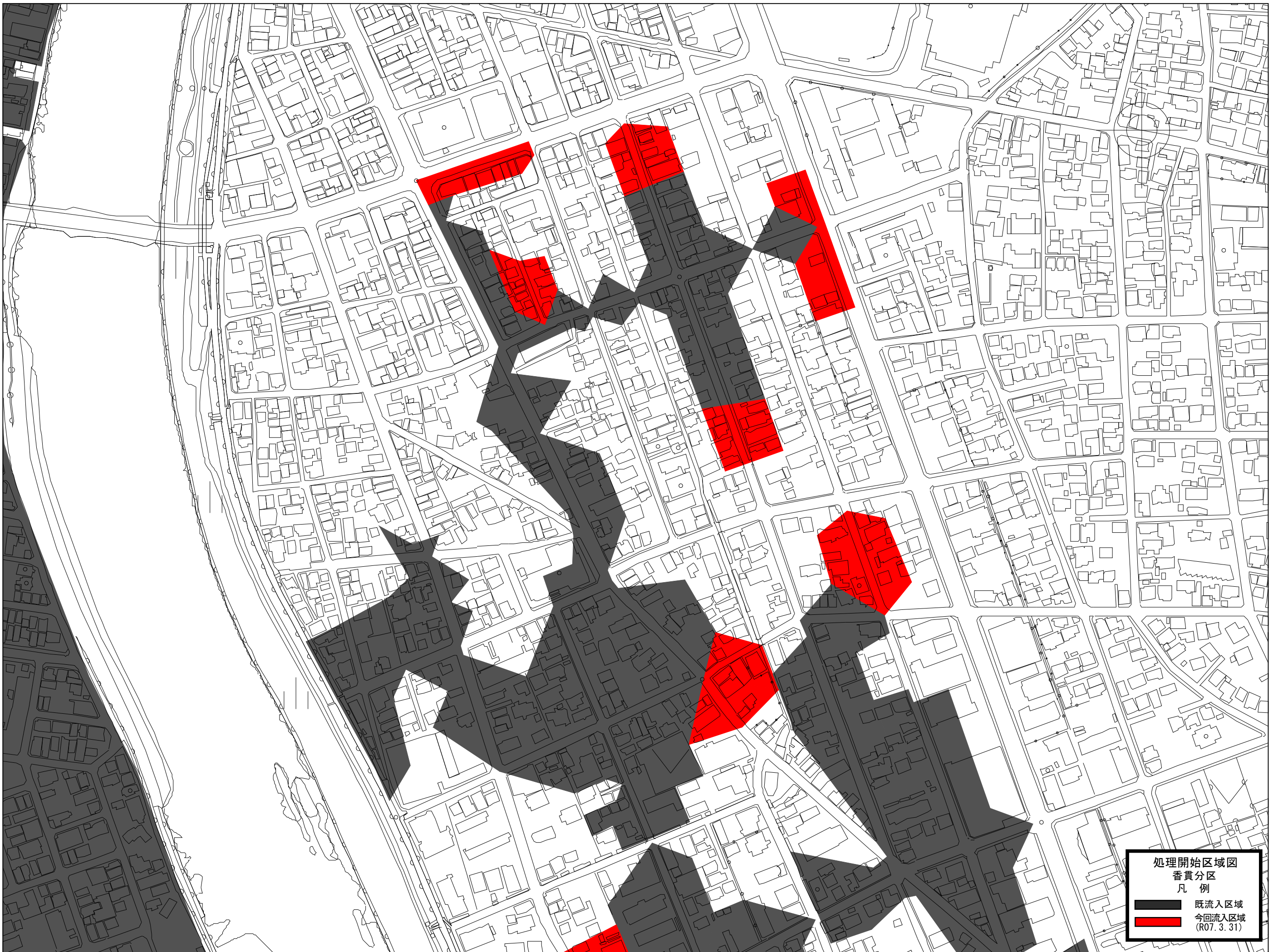
[ 香贯分区北-1 ]