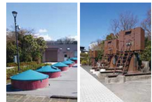
(左) 深井戸 (右) 送水ポンプ450kw (1台)・270kw (3台)