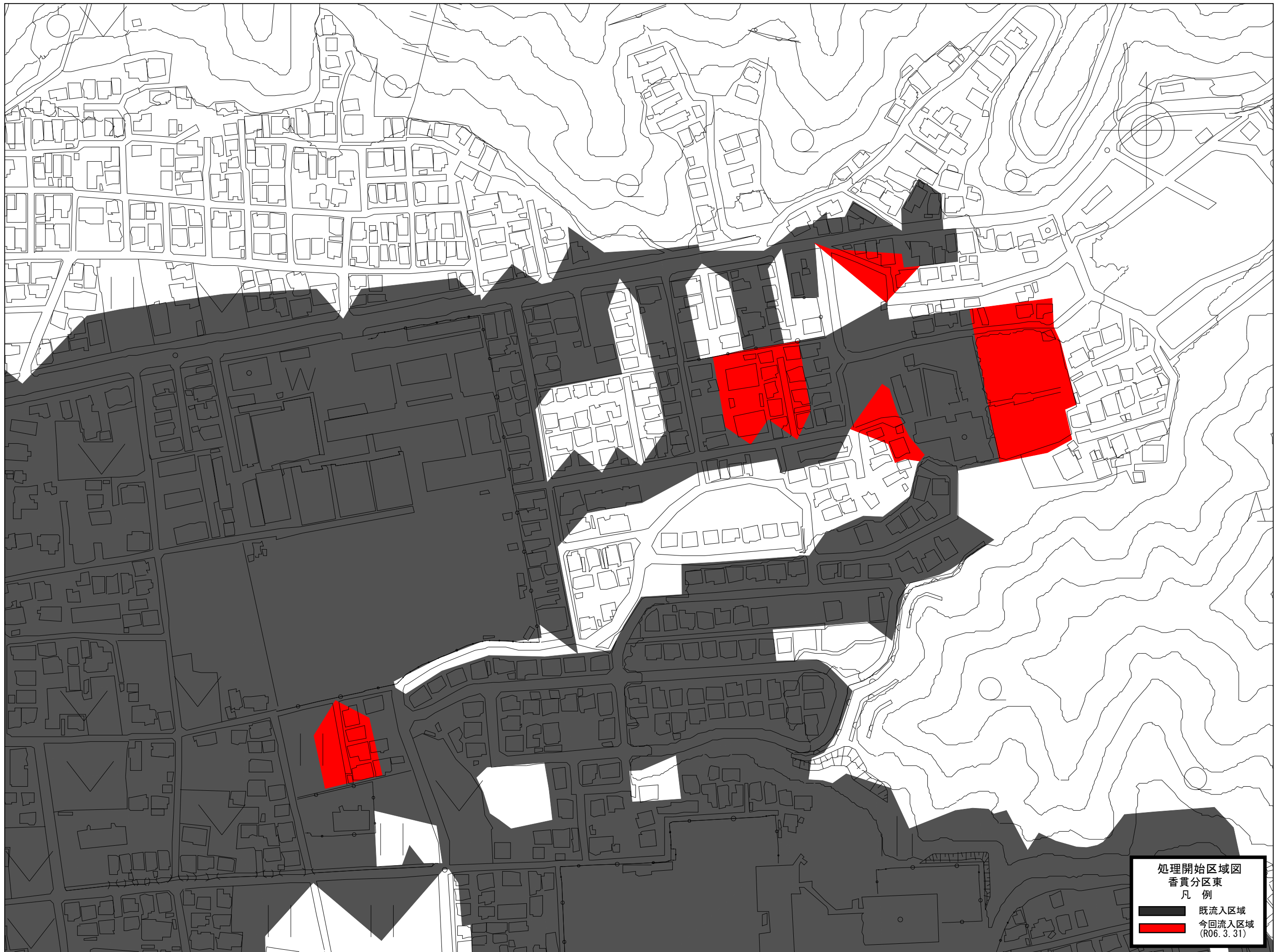
[ 香貫分区東 ]