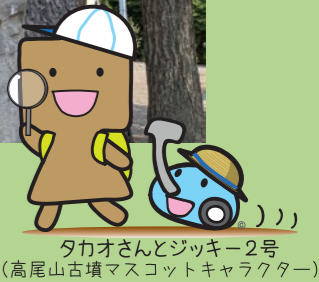
タカオさんとジッキー2号 (高尾山古墳マスコットキャラクター)