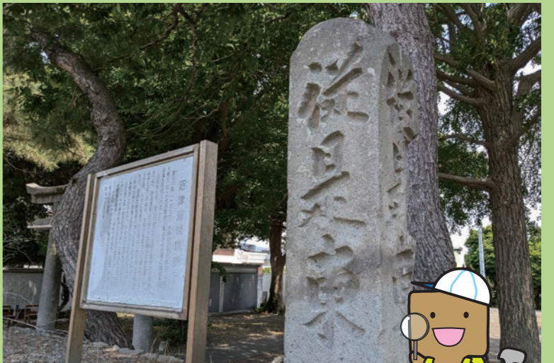
沼津藩領西榜示杭