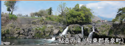
鮎壺の滝 (駿東郡長泉町)