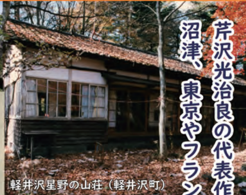
軽井沢星野の山荘 (軽井沢町)