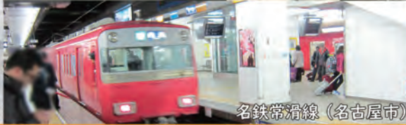
名鉄常滑線 (名古屋市)