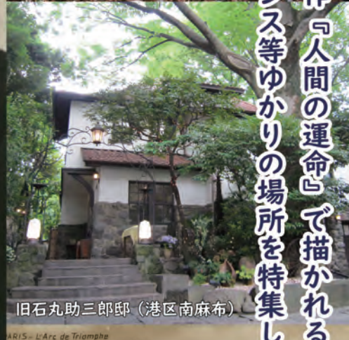
旧石丸助三郎邸 (港区南麻布)