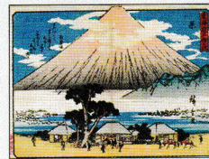
狂歌東海道五十三次 原