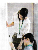
沼津朝日新聞の取材を受ける実習生

またこの展示は、学芸員資格取得を目指す大学生が実習として担当しています。当館では博物館実習生の受け入れをしており、毎年数名の大学生が約2週間の実務を勉強します。今年は2名が現場に立ちました。大学内では味わえない、学芸員の地道な仕事の現状を肌で感じながら学ぶための実習で、実際の企画展示を担当し、人の目に触れる中で作業をすることができる、大変貴重な機会になっています。