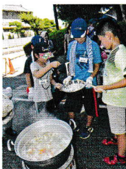
TVの取材も入りました！

小学4~6年生24名が、戦争体験者の話を聞いたり、すいとん作りなどを体験しました。