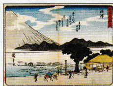
狂歌東海道五十三次 沼津

当館では毎年、沼津信用金庫本店（大手町）のストリートギャラリーで、館蔵資料展を開催しています。今年は9月4日（水）から27日（金）まで、「大きな浮世絵展」を開催しました。タイトルの通り、標準的なサイズ（B4くらい）の浮世絵を、縦横4倍、面積で言うと約16倍に拡大して展示したことで、普段見慣れた浮世絵とは一味違った世界が見えたのではないかと思います。