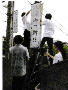
館北側の看板設置