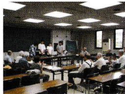
戦争体験を記録する会