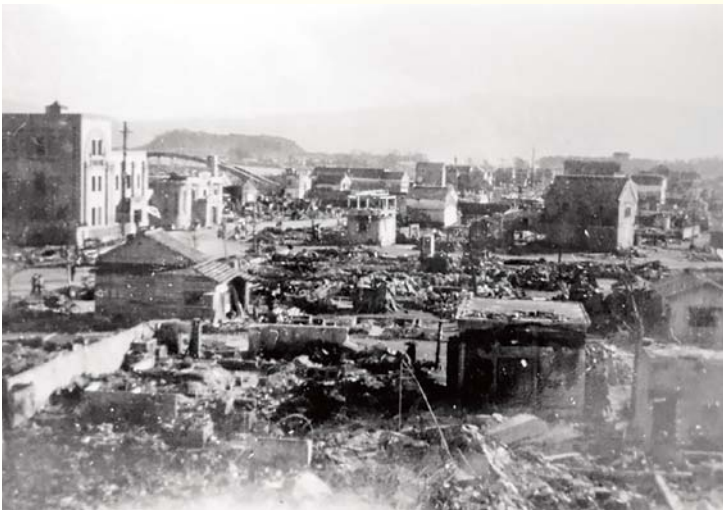
空襲後の沼津市街地

沼津が空襲された理由として、海軍技研や沼津海軍工廠を始めとした軍需工場の存在が挙げられることがあるが、米軍の作戦任務報告書を見る限り、軍関係施設の存在は把握していたが、積極的な攻撃理由、目標とはなっておらず、また、実際の攻撃時にも軍関係施設を主目標としたわけではなかった。このことは、軍関係施設が焼けず、戦後になって学校などに転用されたことから明らかである。やはり、沼津が都市であったことが空襲を受けた理由といえよう。