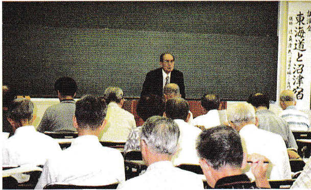
▶歴史講演会の様子

また、企画展に合わせ、8月26日に開催した歴史講演会「東海道と沼津宿」にも、62名の受講者がありました。