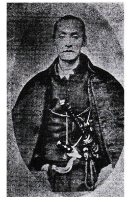
中島三郎助 （『同方会誌』より）