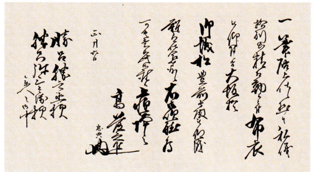
兄と甥に布衣昇進を知らせる手紙（勝呂 安氏所蔵）

しかし、そんな出世街道も行き止まりとなる。幕府の崩壊である。慶応四年正月、鳥羽・伏見の敗戦を大坂で迎え、母・妻・息子・娘と家来・下女数名を引き連れて和歌山経由で脱出、同月下旬には船路郷里である戸田村へもどった。実家では思いもかけない幕府瓦解を嘆き合ったに違いない。その後家族を実家に預け江戸へ帰った彼は、大坂町奉行所の廃止により勤仕並寄合を命じられる。そして駿河への移住。幸いにも