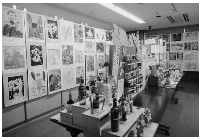
小・中学校美術展

出品種目は絵画・工作・版画・工芸・彫塑・デザイン・書写など、平常学習時における優秀作品について校内審査のうえ展示する。