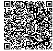
ネット申込用QRコード

受付中 ※定員になり次第受付終了 ☆ 新型コロナウイルス感染拡大防止のため、託児は行いませんが 子供同伴の場合は別室にて講座を視聴できます。(先着10組) 詳しくは電話にてお問い合わせください。