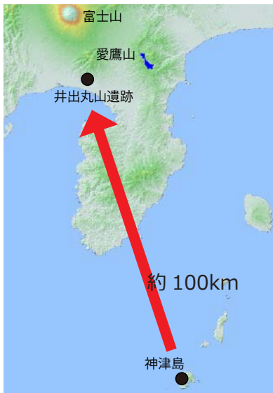
井出丸山遺跡と神津島の位置

沼津市の北側に広がる あしたかさんろく 愛鷹山麓には、旧石器時代や縄文時代の遺跡が数多くあります。浮島地区の いでまるやま 井出丸山遺跡は、平成 17～18 年にかけての発掘調査で、約 3 万 7 千年前の地層から石器（石を割って作った道具）が出土しました。井出丸山遺跡は市内で確認されている最古の遺跡で、日本全体で見ても最古級の遺跡の一つです。