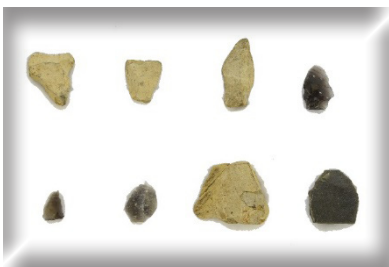
井出丸山遺跡出土の石器

伊豆半島の南端からも約 50km 離れている神津島。当時の人々は、どのように海を渡ったのでしょうか。文化財センターでは、令和 2 年夏ごろに海をテーマにした講演会や体験学習会を開催する予定です。当時の技術で作られた舟を実際に見ることができるかも！