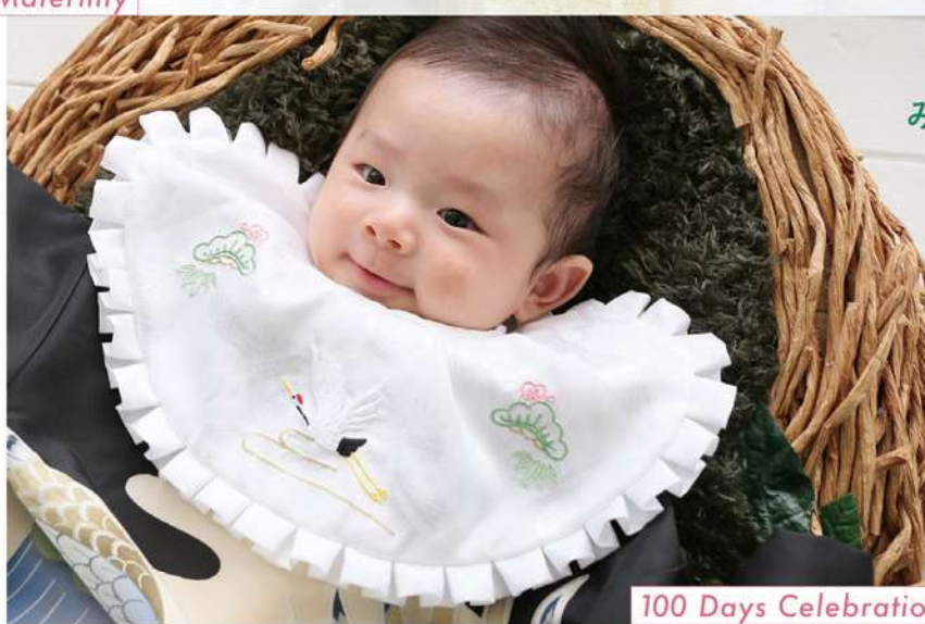
100 Days Celebration Half Birthday

ファミリーフォトスタジオ ヒコは 自然光あふれる写真館で みなさまの大切な日を祝う お手伝いをいたします