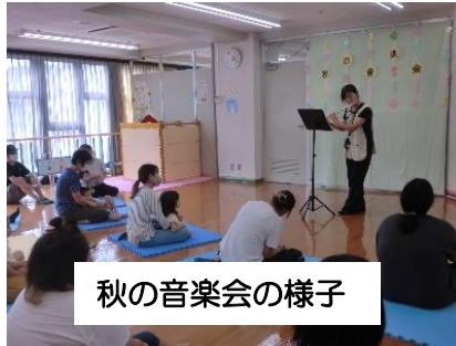
秋の音楽会の様子