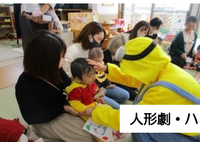
人形劇・ハロウィーンの様子

多くの方にご協力いただき、 20Kg (4人分のワクチン) になりました！ ありがとうございます！（※約5kgで1人分のワクチンになります）