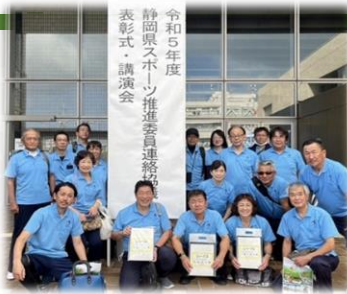
【実技研修会・研究大会】

他市町のスポーツ推進委員の研究発表や講演を聞き、今後の活動の参考とする貴重な研修会です。