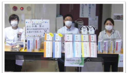
～健康茶の試飲・薬の相談～

沼津市民の健康増進のため、特定健診・がん検診に関わる様々な普及啓発活動にご尽力をいただいています。