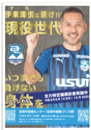
2021 健診普及啓発ポスター