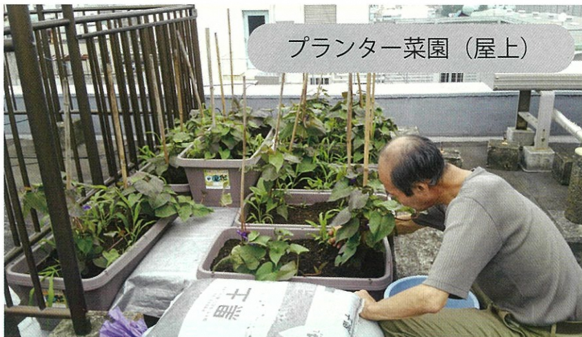
プランター菜園 (屋上)

就労・自立を目指すうえで障害が出てきたときは、POPOLOスタッフを中心に、各連携機関と相談しながら本人の支援を行っていきます。