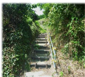
津波避難路整備 (階段・手すり設置等)