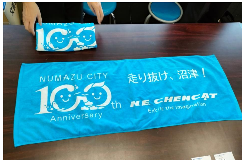
市町村対抗駅伝応援タオル