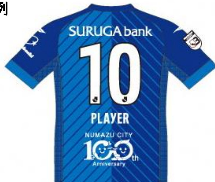
アスクラロ沼津 2023シーズン ユニフォーム