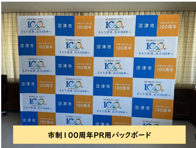
市制100周年PR用バックボード