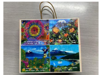
市長、教育長賞の作品は、式典等で使用する紙袋のデザインに採用しました。

小学生の部 143 作品、中学生の部 26 作品、合計 169 作品の「沼津愛」溢れる素敵な作品をご応募いただきありがとうございました。