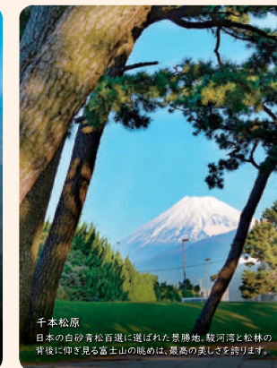
千本松原 日本の白砂青松百選に選ばれた景勝地。駿河湾と松林の背後に仰ぎ見る富士山の眺めは、最高の美しさを誇ります。

人とまちと 美しい自然の調和から、 魅力ある観光の 振興のために 温暖な気候に恵まれた沼津市は、富士の雄姿を背に、海、山、川といった四季折々にも美しい自然を身近に数多く持ちあわせています。この豊かな恵みを将来にわたって市民が共有できるように、一層の保護や育成に努めます。また、自然環境のさまざまな機能に着目しながら、歴史や文化と融合させるなどして、自然の持つ魅力をさらに活用し、個性あふれる観光の振興へとつなげていきます。