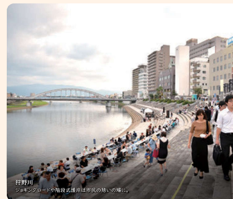
狩野川 ジョギングロードや階段式護岸は市民の憩いの場。