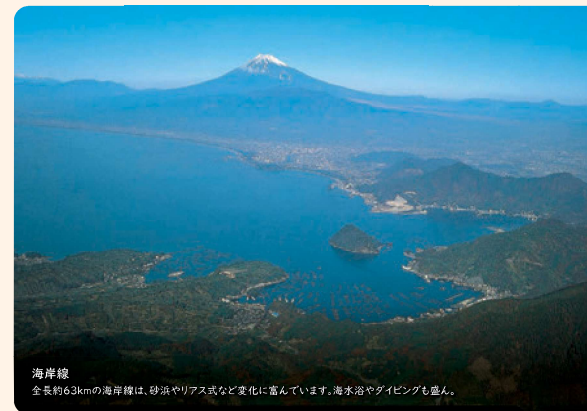
海岸線 全長約63kmの海岸線は、砂浜やリアス式など変化に富んでいます。海水浴やダイビングも盛ん。