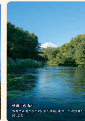
柿田川の湧水 市内で必要な水の約6割を供給。東洋一の湧水量を誇ります。