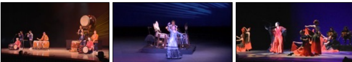
【Special Art Stage ～響宴～】