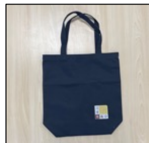
【製作したクリアファイルとトートバック】

沼津市議会100周年を記念して、クリアファイルとトートバックを制作し市民や来沼者にPRしました。