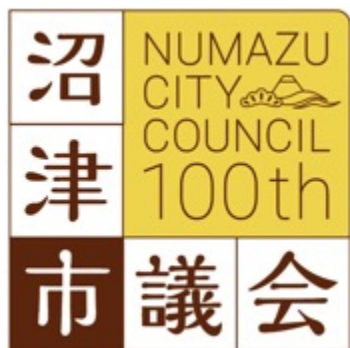
【沼津市議会100周年ロゴマーク】