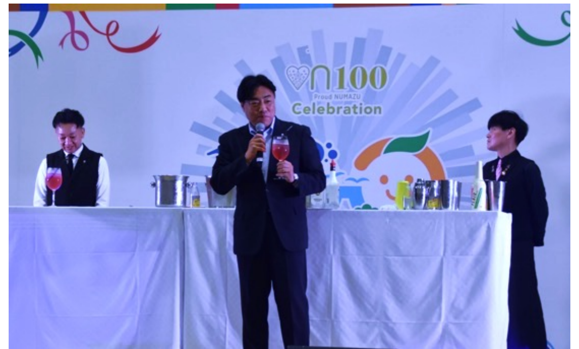
【考案されたカクテルに、記念イベントで命名した際の様子】

1から5をシェイクしてグラスに注ぎ、6のトニックウォーターにてフルアップして完成です。