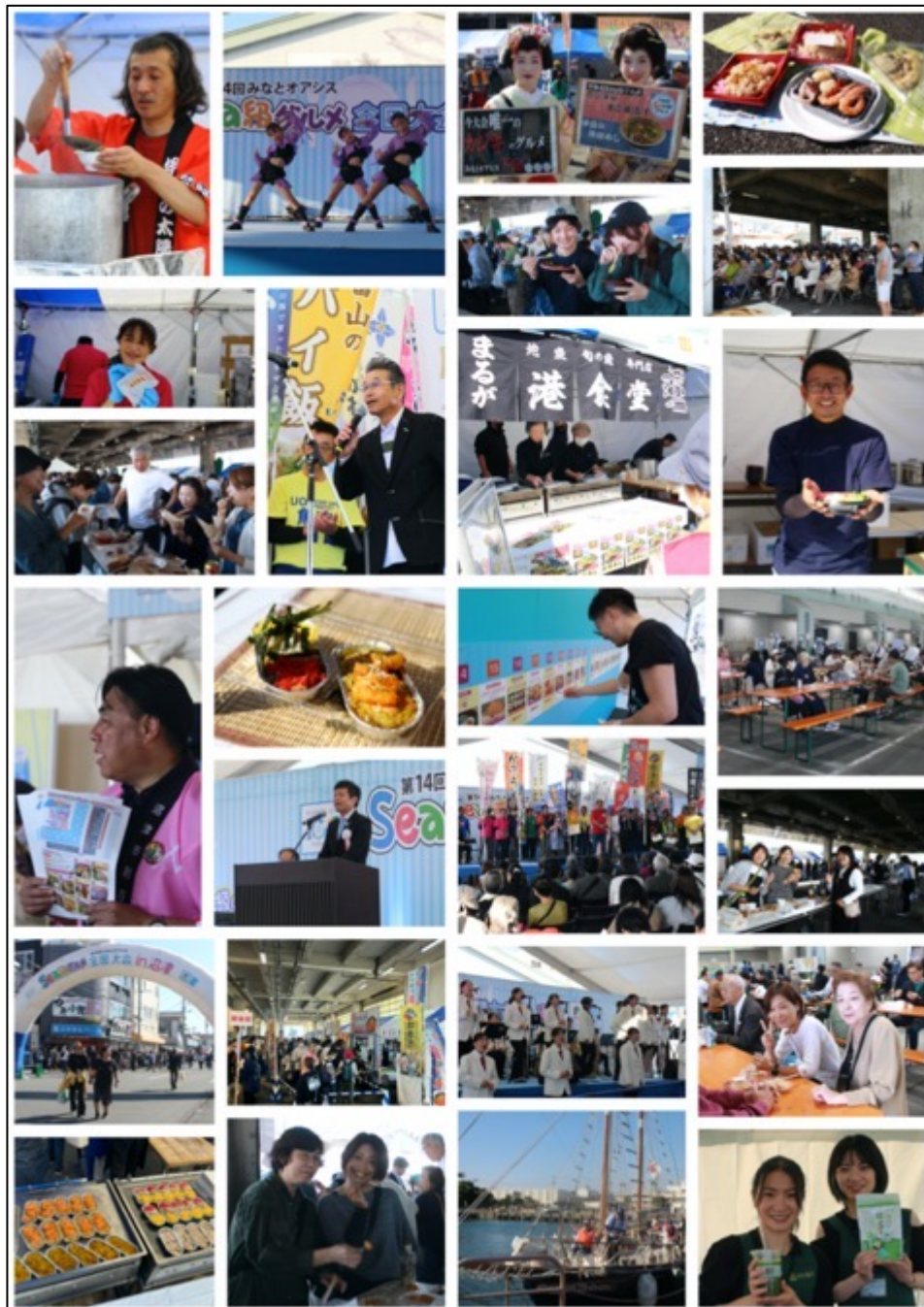
【Sea級グルメ全国大会フォトギャラリー】