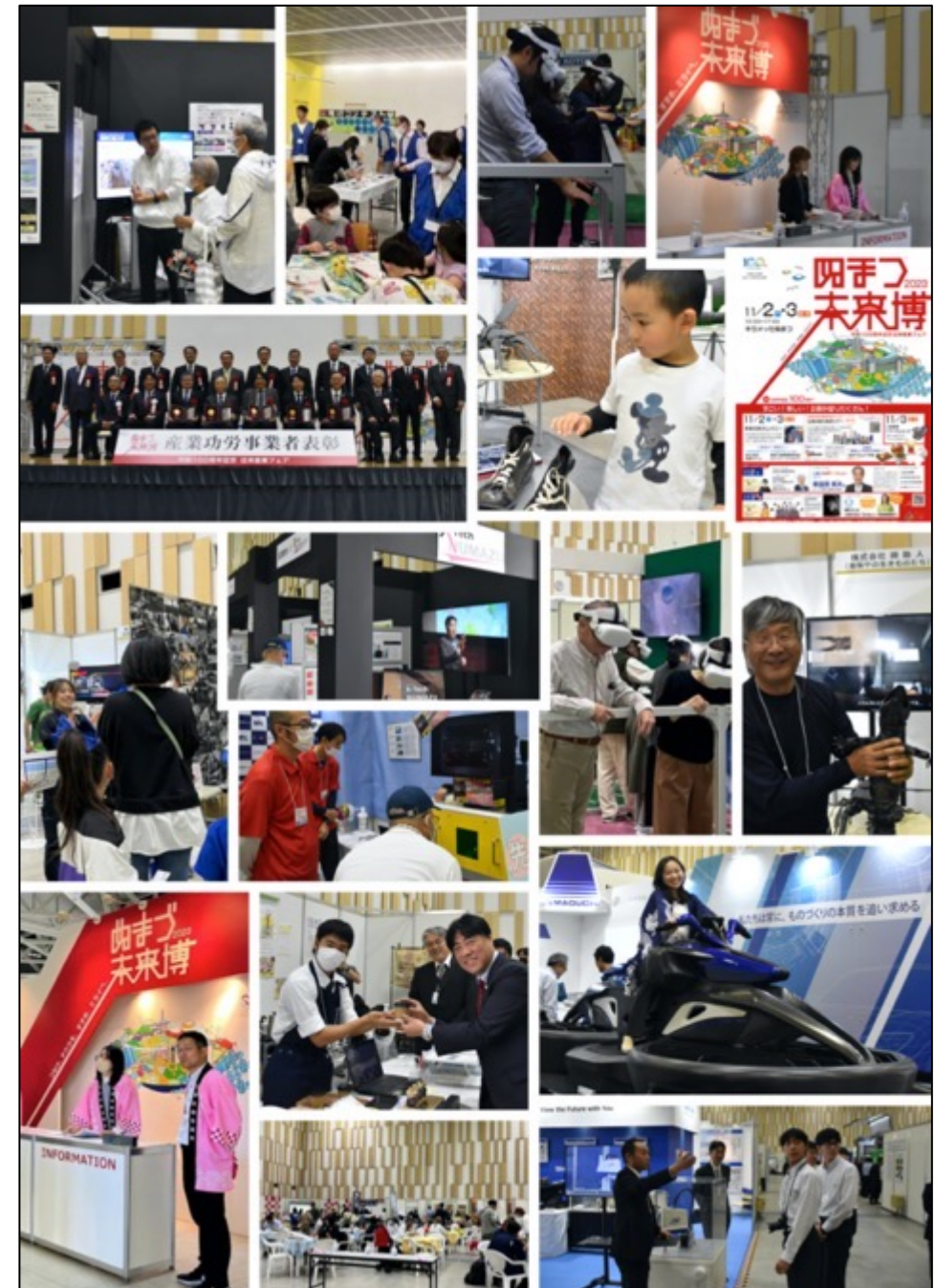
【ぬまづ未来博フォトギャラリー】