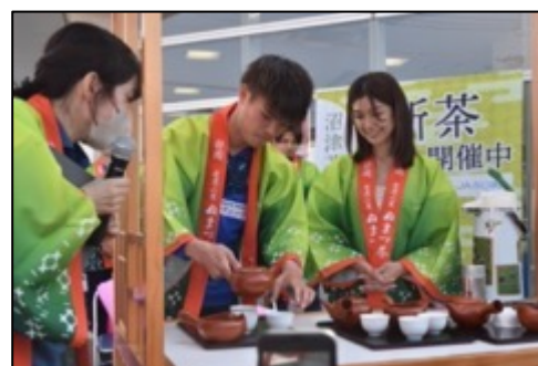
【イベント開催時の様子】