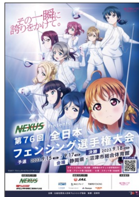
【大会公式ポスター】