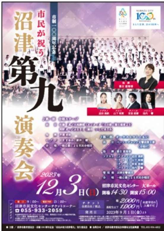
【イベントポスター】