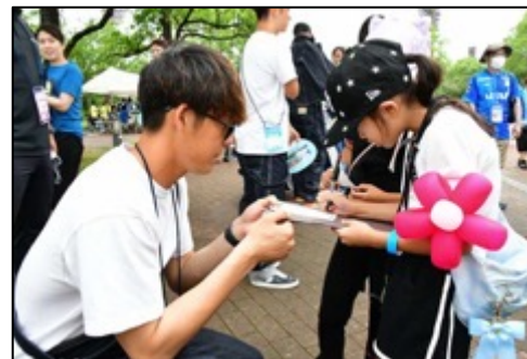
【イベント開催時の様子】