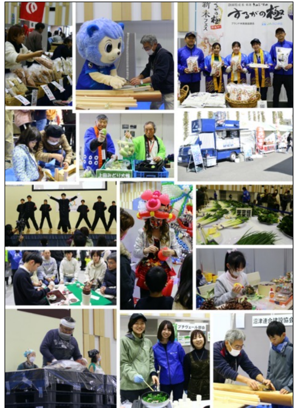
【第54回沼津農林水産まつりフォトギャラリー】