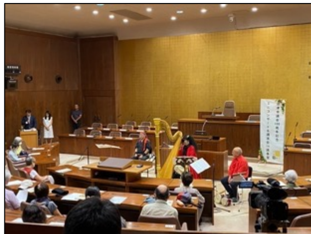
【ミニコンサートの様子】