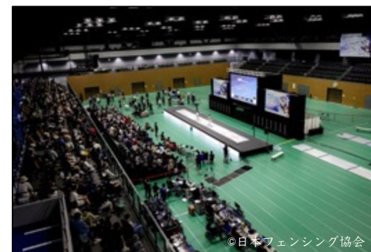
【大会会場内の様子】