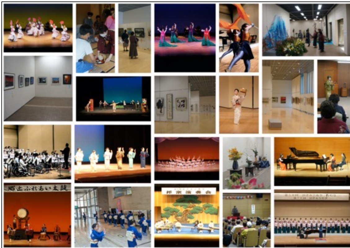
【芸術祭フォトギャラリー】