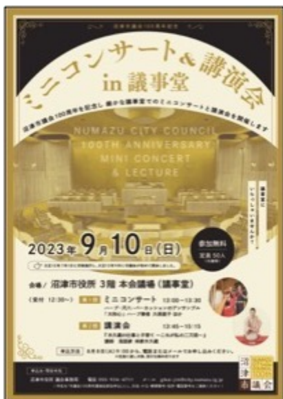
【イベント告知ポスター】