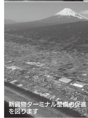
新貨物ターミナル整備の促進を図ります