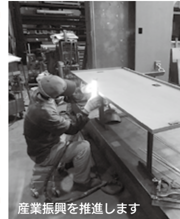
産業振興を推進します

様々な情報を、より効果的な施策展開に繋げるため、オープンデータの積極的な活用を促進する組織として、情報システム課に「オープンデータ利活用推進係」を新設します。(市役所8階)