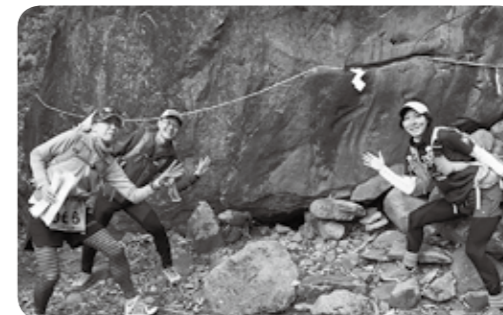
チェックポイントでは、指定されたポーズをとっ て写真を撮影します！

地図に記載されたポイントを探し だし、どのポイントをどう順番 で回るかを各チームで決め、制限時 間内でできるだけ高得点を取るの が目標です。チームワーク、読図力、 そして作戦もロゲイニングの大事 な要素で、このスポーツの特徴と面白 さでもあります！