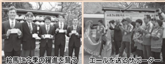
絵馬に今季の躍進を誓う