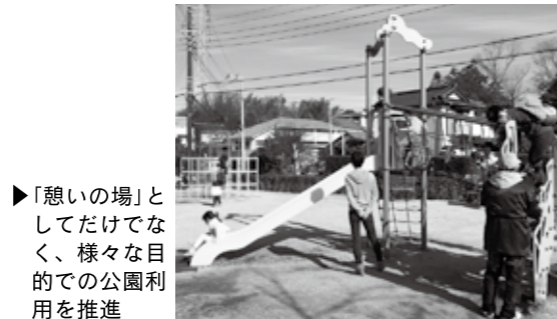
▶「憩いの場」としてだけでなく、様々な目的での公園利用を推進