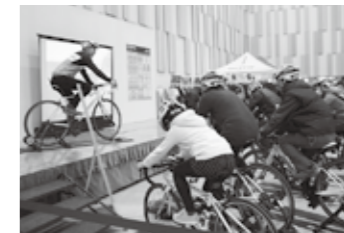
◀▲サイクル事業やJ3を舞台に戦うアスルクラロ沼津など、スポーツを活かした観光産業の活性化やまちのにぎわいづくりを創出