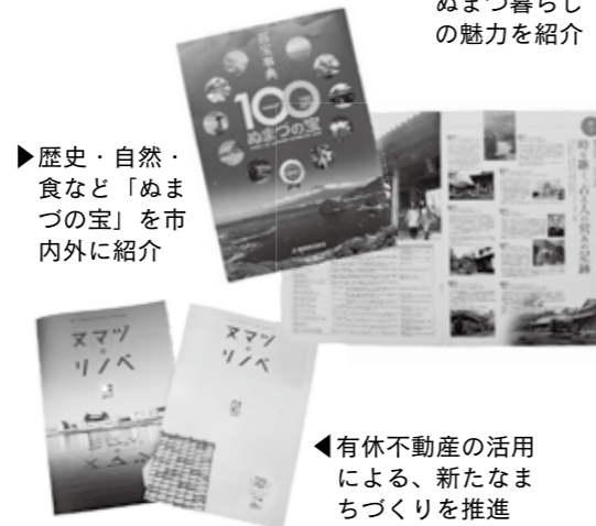
▶歴史・自然・食など「ぬまづの宝」を市内外に紹介