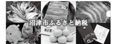
◀▲沼津が誇る風景や特産物を返礼品としたふるさと納税など、沼津の魅力を積極的に発信