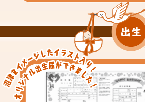
沼津をイメージしたイラスト入り！オリジナル出生届ができました！