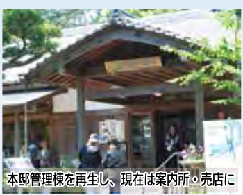
本邸管理棟を再生し、現在は案内所・売店に