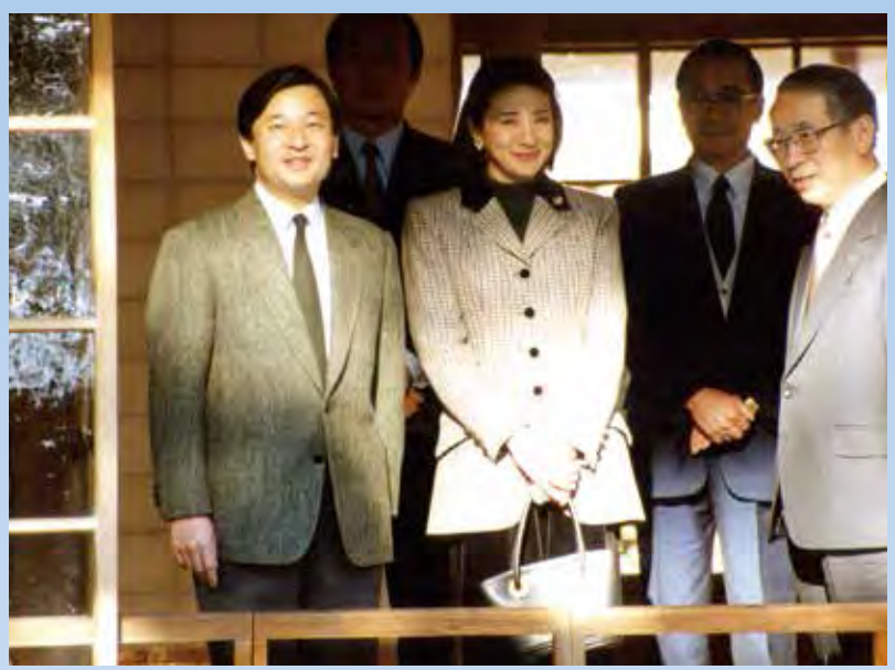
平成12年2月9日 皇太子ご夫妻ご訪問 皇太子さまは当時28年ぶり、雅子さまは初めてのご訪問で、西附属邸(上写真)などをご見学された。お帰りの際に両殿下は、集まった約300人の市民に対して、笑顔で手を振っておこたえになられた。