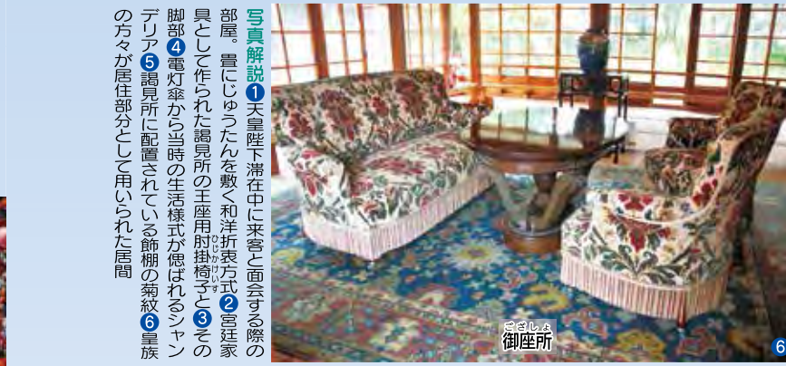
西附属邸は、謁見所などの公的な部分と御座所などの居住部分を組み合わせた大規模な建築物として全国的にも貴重な例であり、住宅史においても意義の高いものとされています。