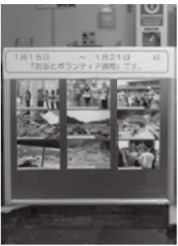
ボランティア活動に関する情報等を展示します。

【申請】予防課(消防設備係) ☎0555・9202・9101 とき 平成28年2月18日(内)・19日(金)