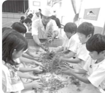
お茶の香りや感触にふれる手揉み体験