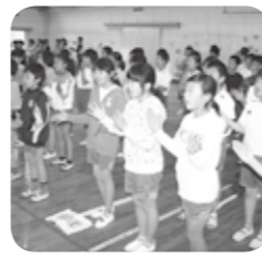
手拍子と共に「Dream」を歌う子どもたち。歌は、愛鷹小学校ホームページから聴くことができる

学校の周りを茶畑が囲む愛鷹小学校。地元の特産品であるお茶に親しむと、毎年3年生が沼津茶手揉み保存会による手揉み体験を行っています。総合的な学習の一環として始まり今年度で14回目を迎えるこの体験では、お茶の手揉み体験やお茶のいれ方のほか、製茶の歴史・工程を学んでいます。この体験を活か